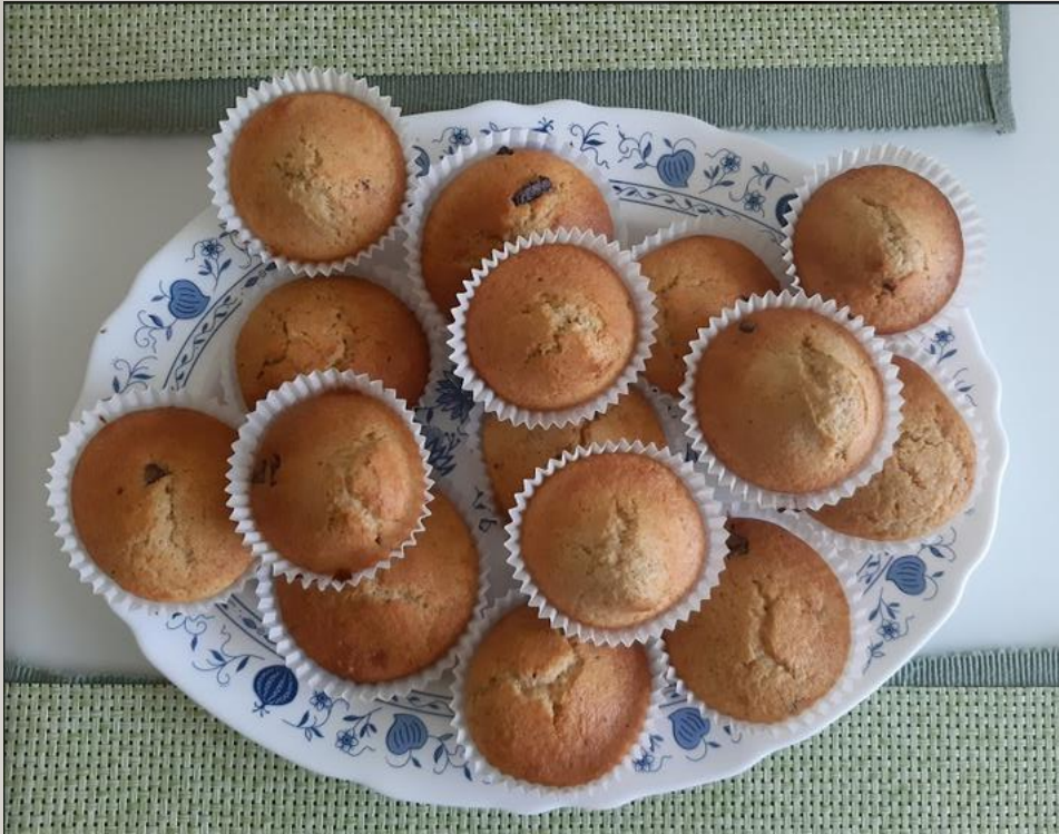
MAFINI S KOŠČKI ČOKOLADE