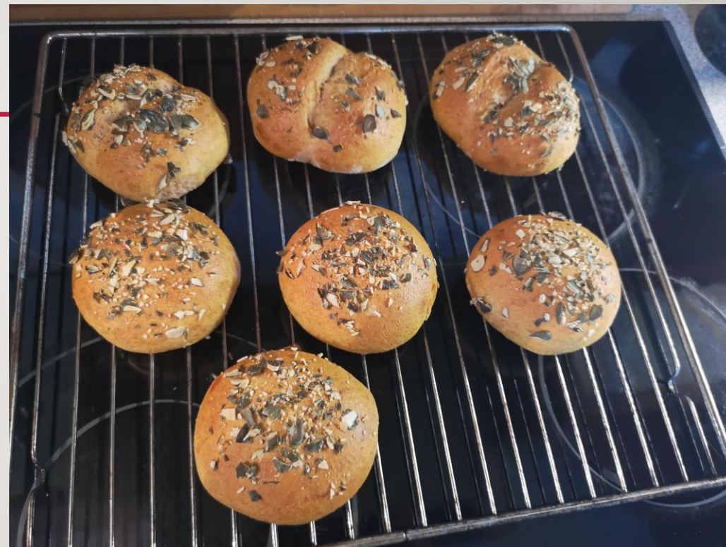
DOMAČE POLNOZRNATE ŽEMLJICE S SEMENI